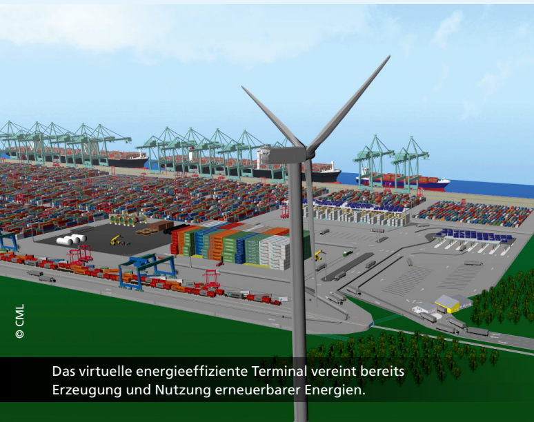
Das virtuelle energieeffiziente Terminal vereint bereits Erzeugung und Nutzung erneuerbarer Energien.

CML ist es nun möglich, die Energieverbräuche auf Terminals sichtbar zu machen: Dabei werden zu jedem Element auf dem Terminal – ob Kran, Fahrzeug oder Gebäude – mithilfe einer Datenbank Informationen hinterlegt, die spezifische Verbräuche, Emissionswerte und Kapazitäten anzeigen. Auf diese Weise können die Energieeffizienz des Terminals dargestellt sowie aktuelle und zukünftige Prozesse bewertet werden. Auf der anderen Seite werden die Möglichkeiten der Energieversorgung durch den Einsatz erneuerbarer Energien wie Solar-, Wind- und Biomasseenergie betrachtet. Basis hierfür ist das Energiemanagement, das über Energieversorgung und Energieverbrauch wacht. „Unser Visualisierungsmodell, ergänzt um Analysen und Recherchen, wird im Zuge der steigenden Effizienz- und Nachhaltigkeitsanforderungen an Terminals ein sehr hilfreiches Werkzeug sein“, so Dr. Svenja Tötter vom Fraunhofer CML.