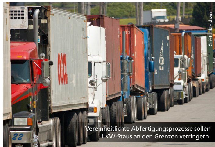
Vereinheitlichte Abfertigungsprozesse sollen LKW-Staus an den Grenzen verringern.

Weitere Ergebnisse unter www.ambercoastlogistics.eu .